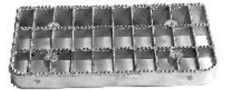
Astinlauta ylä VOF10,12 1509844