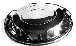
Koristekapseli etu 225ET