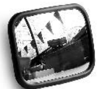
Peili ramppip. 1528 VOFL 1528-458