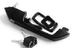
Ovenkahva SC vasen K1-356085