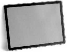
ADR kilpi me46-12000ADR1