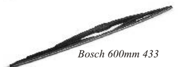
Bosch 600mm 433