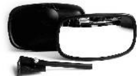
Peili ramppip. 1408 varrella 1408-482