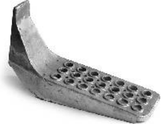
Astinlauta ala VOF10,12 1509846