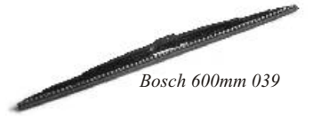
Bosch 600mm 039