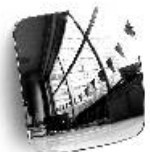
Peilinlasi ramppip. 1528 VOFL 1528-6