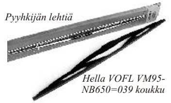
Hella VOFL VM95-NB650=039 koukku