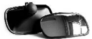
Peili ramppip. 1408 1408-472